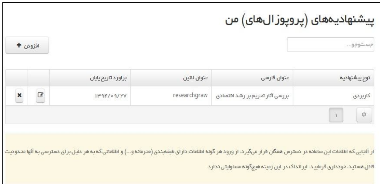
تصویر ۲: پیشنهادیه‌ها

۵-۱ پیشنهادیه‌های من: برای ثبت پیشنهادیه (پروپوزال) های خود از قسمت پژوهش ها و درخواست‌ها روی گزینه پیشنهادیه‌های من کلیک کنید و پروپوزال‌های خود را به همراه جزییات خواسته شده وارد کنید.