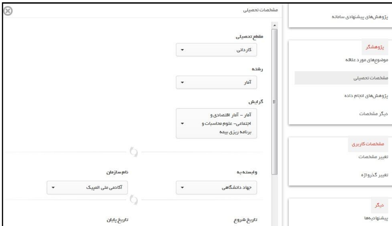
تصویر ۱: مشخصات تحصیلی

۵-۱ پیشنهادیه‌های من: برای ثبت پیشنهادیه (پروپوزال) های خود از قسمت پژوهش ها و درخواست‌ها روی گزینه پیشنهادیه‌های من کلیک کنید و پروپوزال‌های خود را به همراه جزییات خواسته شده وارد کنید.